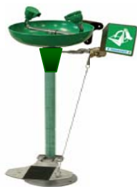
Immagine puramente illustrativa, per caratteristiche e dettagli leggere quanto riportato nella scheda tecnica.

FAMIGLIA PRODOTTO: LAVAOCCHI E DOCCE D'EMERGENZA