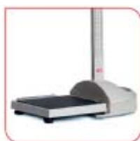
seca 217 in combinazione con la bilancia seca 877